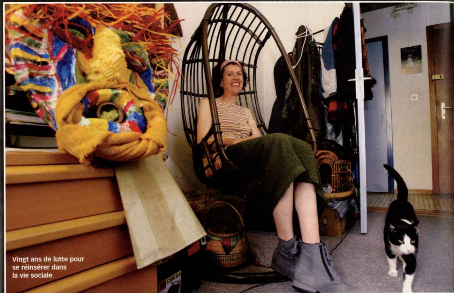
Vingt ans de lutte pour se réinsérer dans la vie sociale.

d'informatique après mon accident, et maintenant une existence confrontée à l'exclusion.» Elle a monté une boîte avec son ami de l'époque, qu'elle avait connu une année avant le drame. Ensuite, elle est partie seule en Afrique et en Inde. Elle s'est mariée avec un autre homme et s'est séparée. Elle travaille aujourd'hui dans le social à 25% et bénéficie d'une rente qui lui assure un revenu de 4000 francs. «Ce qui me manquait le plus, c'était de ne pas pouvoir faire quelque chose avec les autres. Le théâtre me permet enfin d'être acteur à part entière, avec ma personnalité et mon handicap.»